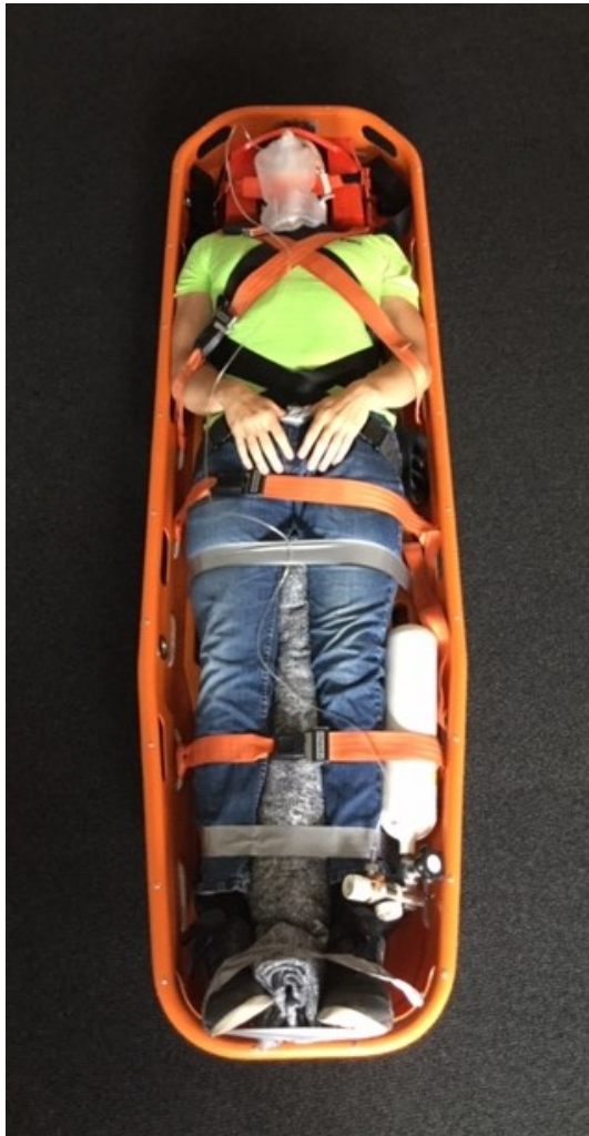
Person på spineboard lagt i hejsebåre.

Vær opmærksom på, at halskrave kun anvendes, hvis det er ordineret af Radio medical.